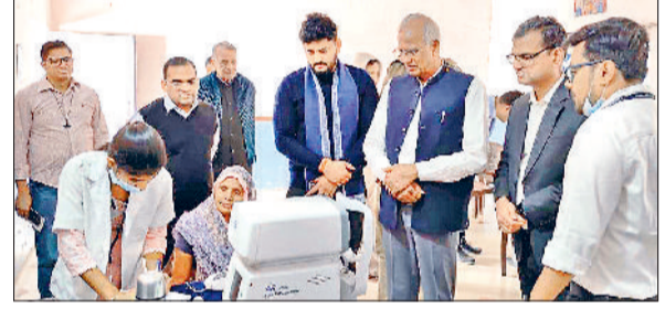
महेंद्रगढ़। नेत्र जांच शिविर में भाग लेते कार्यक्रम में मौजूद अतिथि व अन्य।