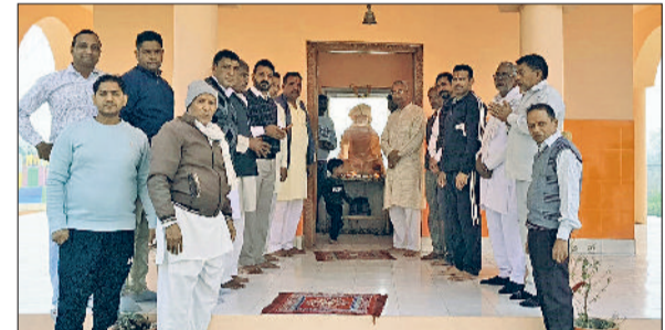
बाबा जीतनाथ को नमन करते श्रद्धालु

इसके बाद विशाल भंडारे का आयोजन किया, जहां पवित्र ब्रह्म होकर अनेक लोगों ने प्रसाद ग्रहण किया। उन्होंने बताया कि बाबा जीतनाथ की स्मृति में हर वर्ष 23