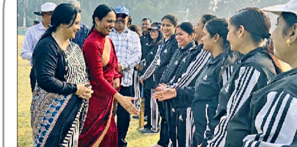
खिलाड़ियों का परिचय लेकर मैच शुरू करवाते हुए।