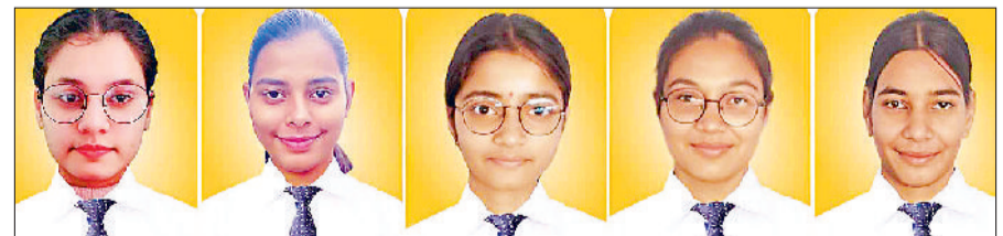
महेंद्रगढ़। टॉप टेन में रहने वाले विद्यार्थी।