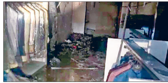
नारनौल। आग लगने से शोरूम में जला सामान व मौके पर पहुंची फायर ब्रिगेड की गाड़ियां।

उन्होंने बताया कि शनिवार देर सायं शोरूम को बंद कर घर चला गया था। इसके बाद रात तीन बजे बाद उसके पास किसी अज्ञात व्यक्ति का उसके मोबाइल पर फोन आया और