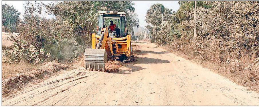
महेंद्रगढ़। कच्चे रास्ते को उखाड़ती जेसीबी मशीन।

निर्माण करने की मांग कर रहे थे, लेकिन जिला प्रशासन की ओर से कोई सकारात्मक जवाब नहीं मिल रहा था। सरकार द्वारा सड़क निर्माण कार्य की स्वीकृति मिलते ही मार्केटिंग बोर्ड ने निर्माण कार्य शुरू कर दिया है। आने वाले समय में उनका सफर आसान होगा। सड़क बनने से ग्रामीणों का आवागमन आसान होगा। अब मार्केटिंग बोर्ड की ओर से एक करोड़ 24 लाख रुपये खर्च कर सड़क बनाई जाएगी। फिलहाल टेकेदार की ओर से कच्चा रास्ता उखाड़ने का कार्य किया जा रहा है।