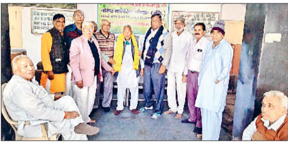
नारनौल। जन्मदिन पर वरिष्ठ नागरिक को सम्मानित करते हुए।