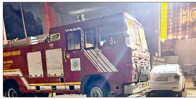
नारनौल। आग पर काबू पाने की कोशिश करते फायर ब्रिगेड कर्मचारी।