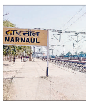
नारनौल। रेलवे स्टेशन।

नारनौल। रेलवे की ओर से चूरू-सादुलपुर रेलखण्ड पर दूधवाखारा-असल एवं दूधवाखारा-हडयाल स्टेशनों के मध्य तकनीकी कार्य हेतु 26 व 27 नवंबर को ब्लॉक लिया जा रहा है। इस कार्य हेतु रेल यातायात प्रभावित रहेगा। उत्तर पश्चिम रेलवे के मुख्य जनसम्पर्क अधिकारी शशि किरण के अनुसार उपरोक्त कार्य के कारण उत्तर पश्चिम रेलवे की रेलसेवाएं प्रभावित रहेंगी। मार्ग परिवर्तित रेलसेवाएं: गाड़ी संख्या 12323 हावड़ा-बाडमेर रेलसेवा 25 नवंबर को को हावड़ा से प्रस्थान करेगी, यह परिवर्तित मार्ग वाया रेवाड़ी-रिंगस-फुलरा-डेगाना होकर संचालित होगी। परिवर्तित मार्ग में यह रेलसेवा नारनौल, नीमकाथाना, रिंगस एवं फुलरा