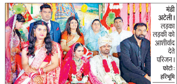
मंडी अटेली। लड़का लड़की को आशीर्वाद देते परिनज।